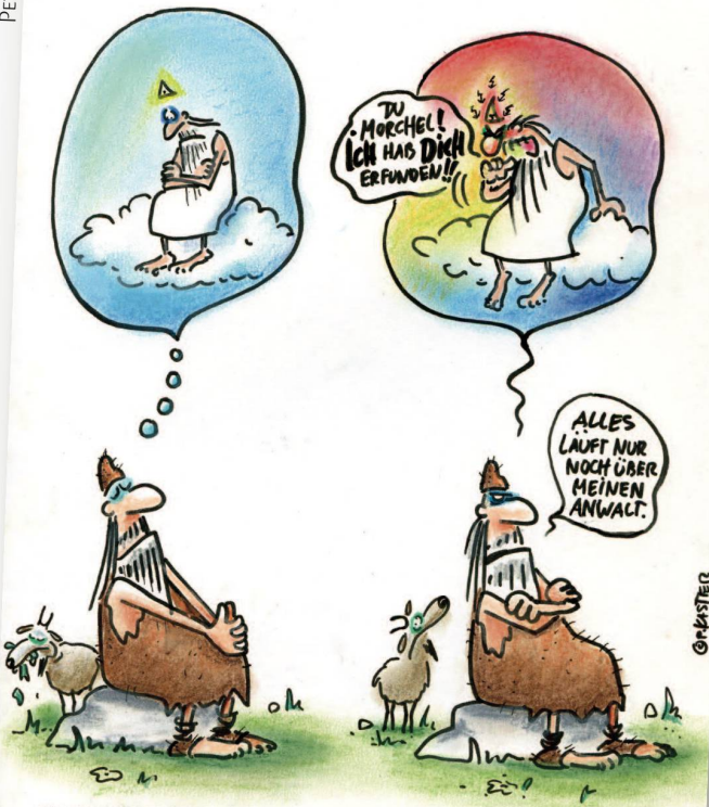
IN DER SPÄTEN FREIZEIT ERFAND EIN HIRTE AUS DEM LANDKREIS DRÜBEND ORF GOTT.