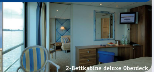
2-Bettkabine deluxe Oberdeck