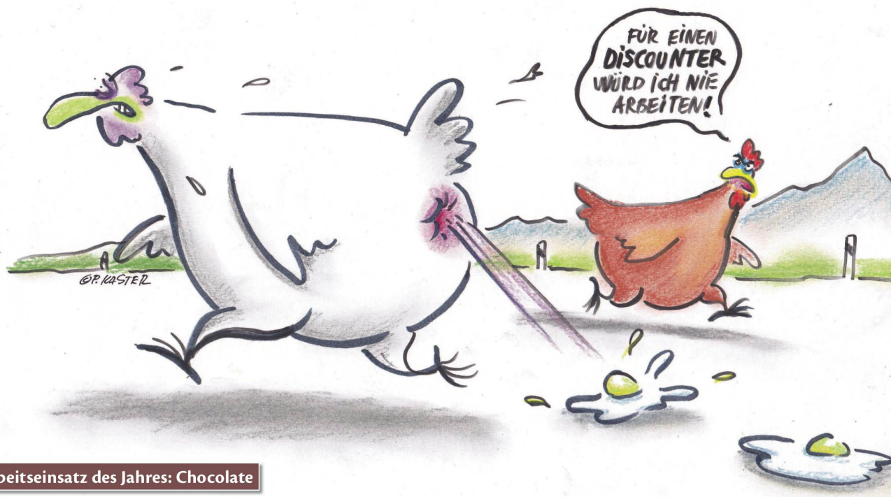
Arbeitseinsatz des Jahres: Chocolate