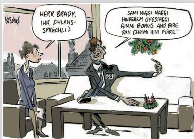
Gehaltsaufbesserung des Jahres: Brady Dougan