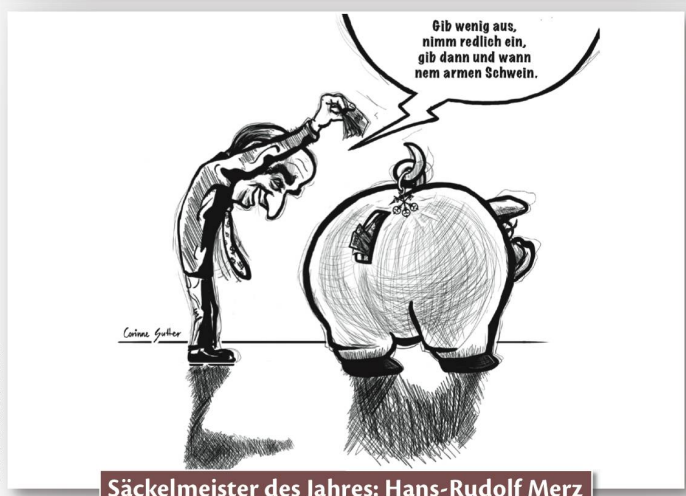
Säckelmeister des Jahres: Hans-Rudolf Merz