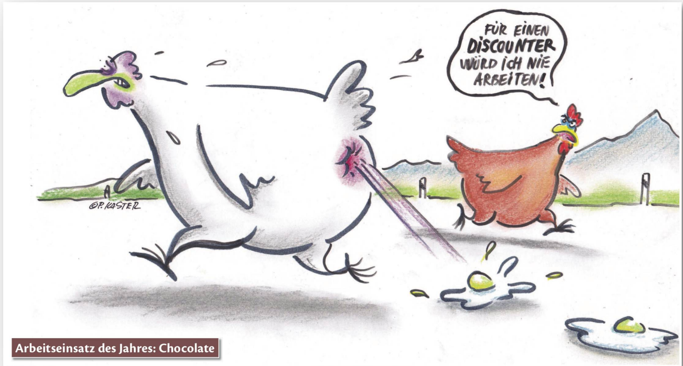
Arbeitseinsatz des Jahres: Chocolate