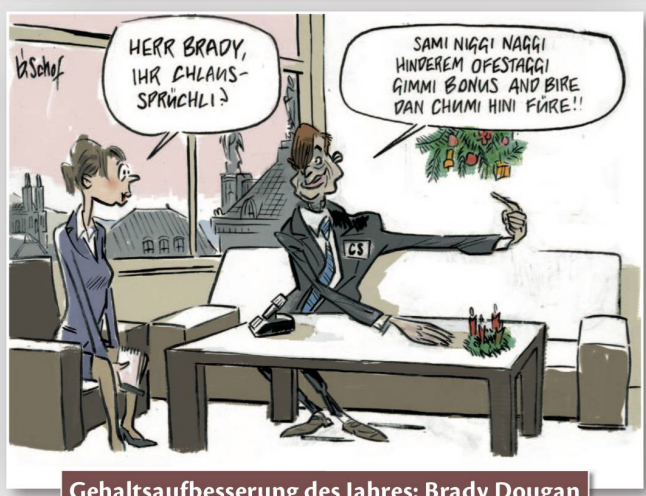
Gehaltsaufbesserung des Jahres: Brady Dougan