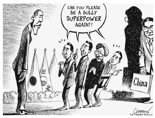
Patrick Chappatte, International Herald Tribune

«Könnten Sie bitte wieder eine bedrohliche Supermacht werden?»