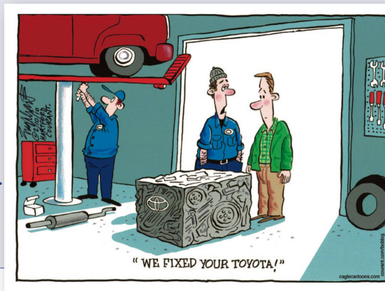
Bob Englehart | Hartford Courant «Wir haben die Probleme mit Ihrem Toyota gelöst.»