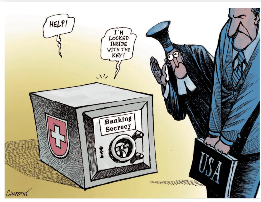
Patrick Chappatte | Le Temps «Hilfe, ich hab mich mit dem Schlüssel eingeschlossen!»