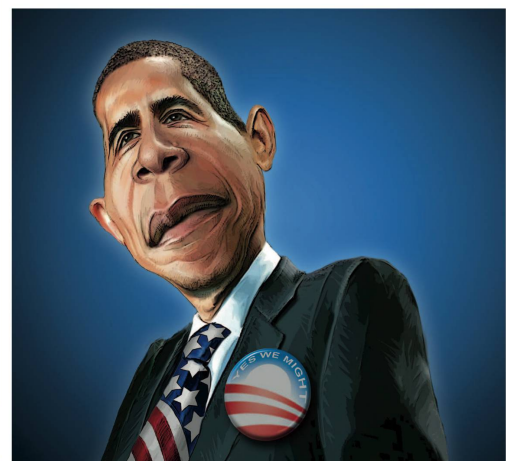
Petar Pismetrovic, Kleine Zeitung | Österreich