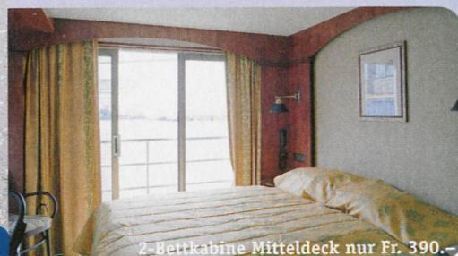
2-Bettkabine Mitteldeck nur Fr. 390.-