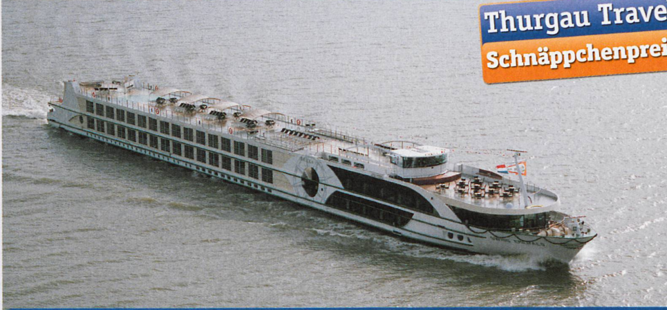
Das Schiff der Reederei Scylla Tours ist sonst nur auf dem amerikanischen Markt buchbar.

(pro Person inkl. Kreuzfahrt mit Vollpension, Hauptdeck hinten, Taxen und Gebühren)