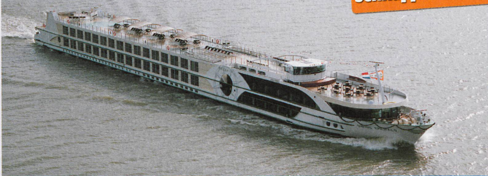
Das Schiff der Reederei Scylla Tours ist sonst nur auf dem amerikanischen Markt buchbar.

(pro Person inkl. Kreuzfahrt mit Vollpension, Hauptdeck hinten, Taxen und Gebühren)