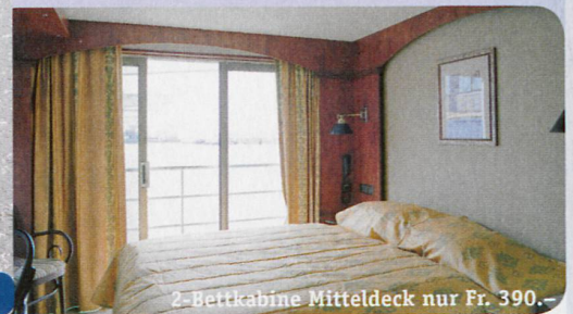
2-Bettkabine Mitteldeck nur Fr. 390.-