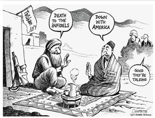
Patrick Chappatte, International Herald Tribune