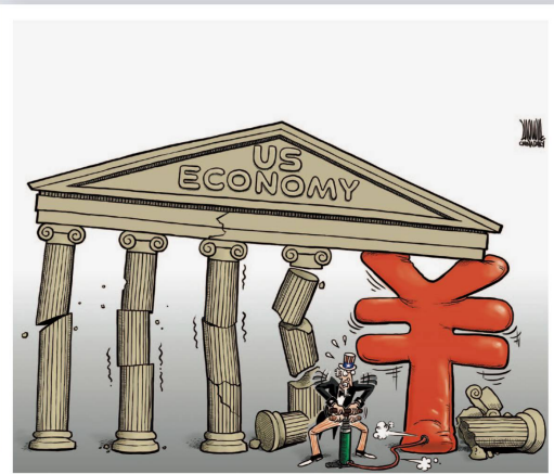
Cardow, Ottawa Citizen, Kanada

Kein Tanklastwagen kommt mehr nach Afghanistan: «Nicht einfach nur rumste- hen, zeig etwas Bein!»