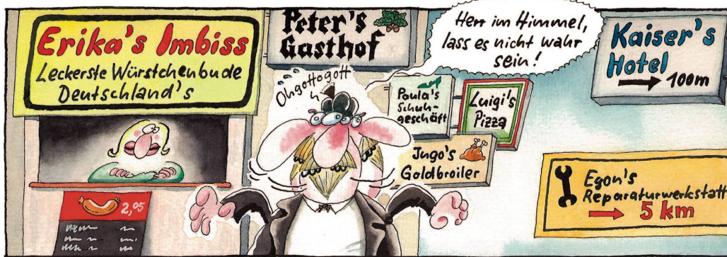
Die konsequente (!), ja absolut vollständige (!! ) Negierung des deutschen Genitivs (!!!) in den fünf neuen Bundesländern ...