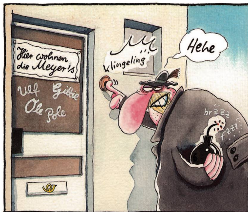
Immer öfter muss er sich sogar schon um die simple deutsche Mehrzahlbildung „kümmern“.