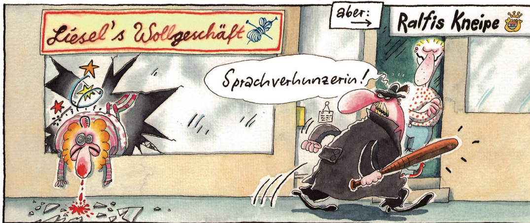
... hinterlässt er eine Spur der Zerstörung!