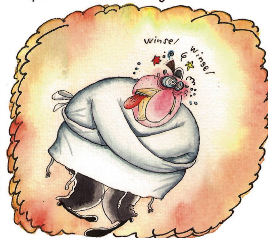
Eine Reise in die Ex-DDR wird ihm schliesslich zum Verhängnis.