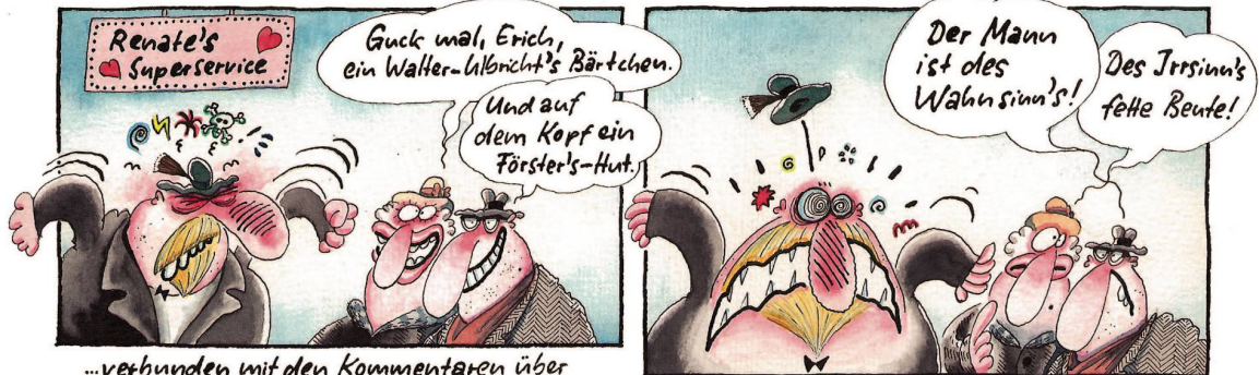
...verbunden mit den Kommentaren über seinen (Waller-Lalbricht-) Spitzbart...