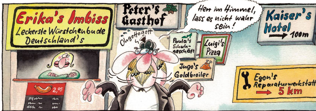
Die konsequente (!), ja absolut vollständige (!! ) Negierung des deutschen Genitivs (!!!) in den fünf neuen Bundesländern ...