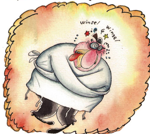
Eine Reise in die Ex-DDR wird ihm schliesslich zum Verhängnis.