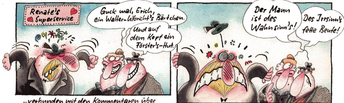
...verbunden mit den Kommentaren über seinen (Waller-Lalbricht-) Spitzbart...