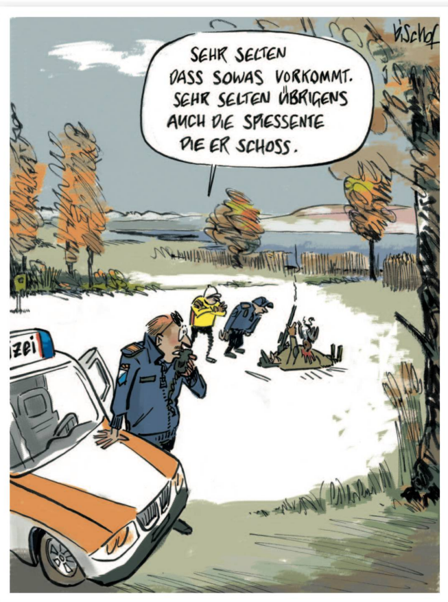
CARTOONS: NICOLAS BISCHOF