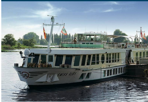
MS Swiss Ruby