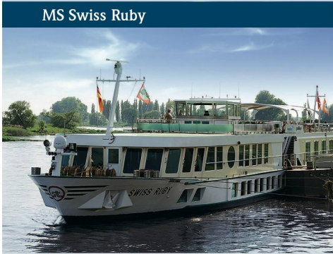
MS Swiss Ruby

Kaum ein anderer Strom als der Rhein ist in Europa Grundlage von mehr Liedern – und kaum ein anderer Schifffahrtsweg hat an seinen Ufern mehr Schlösser und Burgen. Nach viel Geschäftigkeit auf dem breiten Strom beeindruckt die schmale, kurvenreiche Mosel mit ihren kleinen Städten durch entspannende Ruhe und Beschaulichkeit.