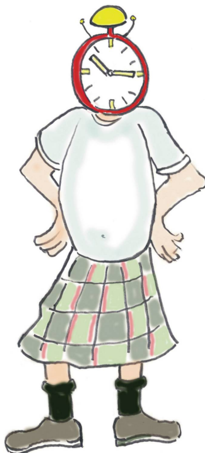
Cartoons: Igor Weber