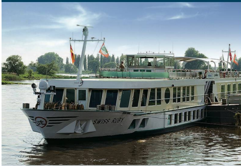
MS Swiss Ruby