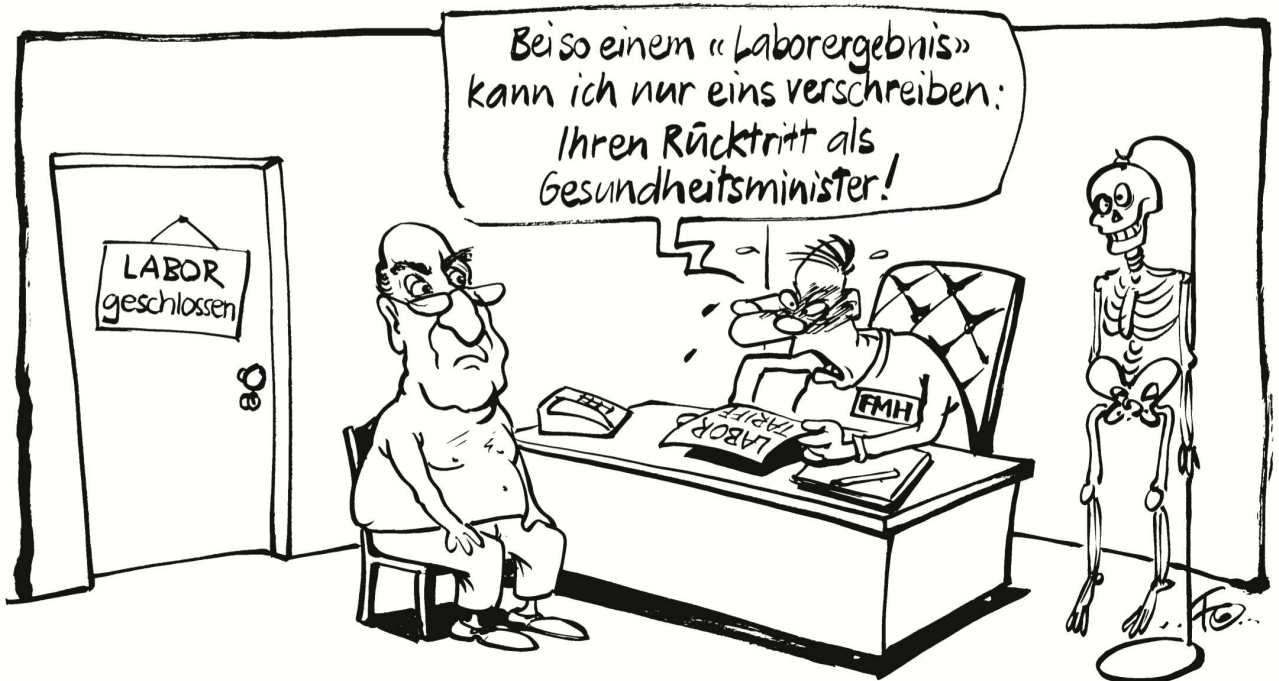
Der Streit zwischen Ärzten und Bundesrat Pascal Couchepin um die neu geltenden Labortarife eskaliert. Die Ärztevereinigung FMH fordert den Rücktritt des Gesundheitsministers.