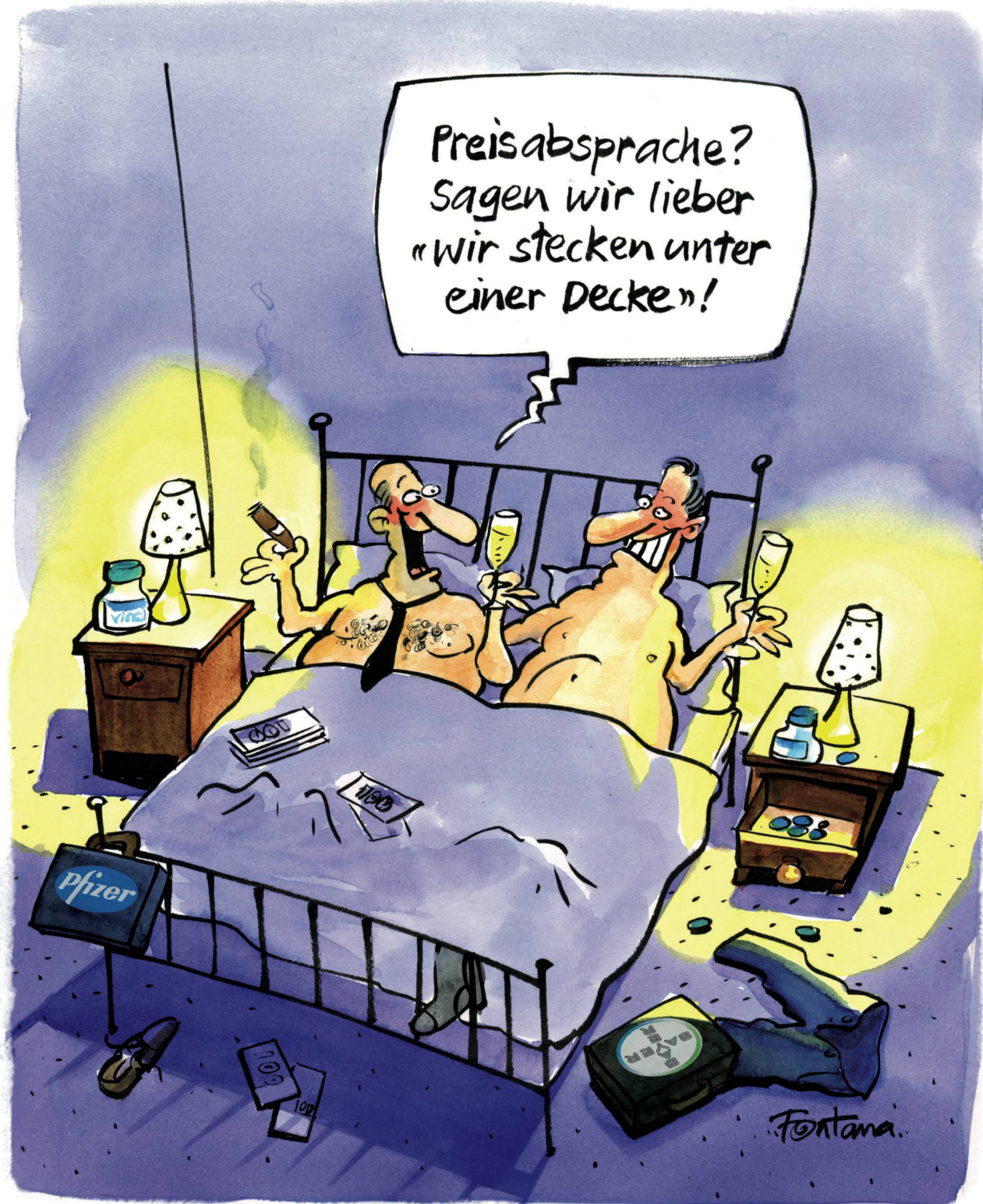
Das Sekretariat der Wettbewerbskommission (WEKO) hat bei den Herstellern und Verkaufsstellen der Potenzmittel Viagra, Cialis und Levitra Preisabsprachen festgestellt.