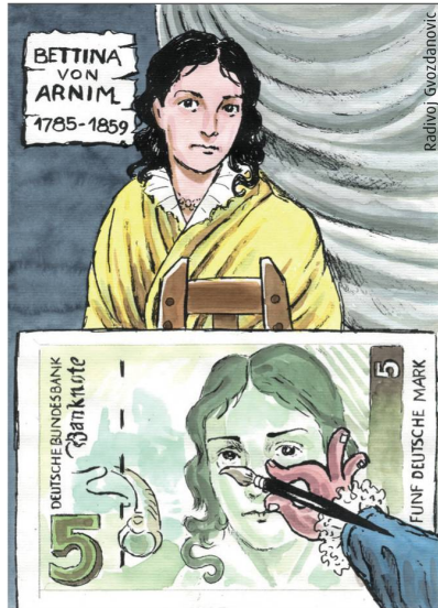
Bettina von Arnim (4. April 1785 – 20. Januar 1859 in Berlin), deutsche Schriftstellerin der Romantik.