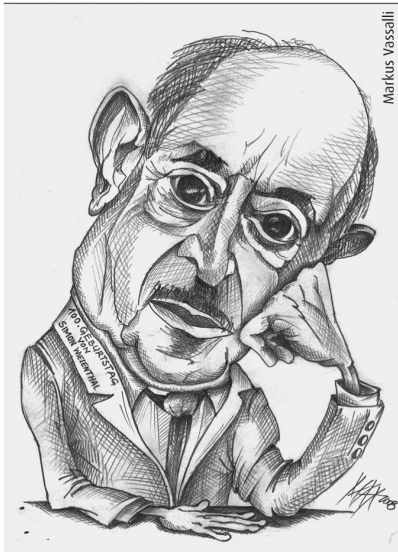
Simon Wiesenthal (31. Dez. 1908 – 20. Sept. 2005), österreichischer Architekt, Publizist und Schriftsteller.