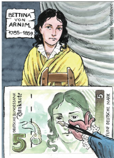
Bettina von Arnim (4. April 1785 – 20. Januar 1859 in Berlin), deutsche Schriftstellerin der Romantik.