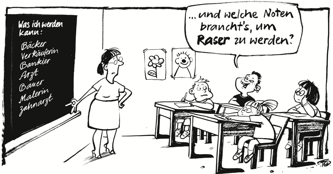
Die Strassenopfervereinigung Roadcross will Raser früher herausfiltern. Die Betragensnote des Schulzeugnisses soll über den Lehrfahrausweis entscheiden.