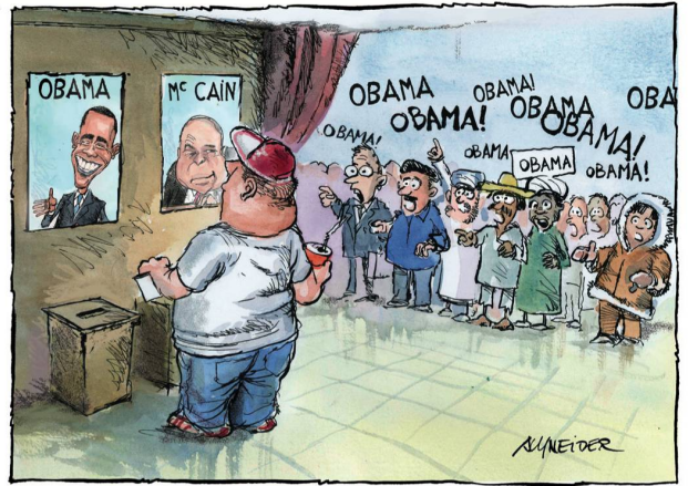
DIE WELT WÄHLT