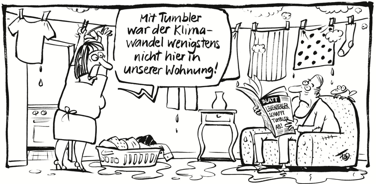
Der Bundesrat hat ein «Revisionspaket für mehr Energieeffizienz» beschlossen. Dieses senkt den Schweizer Stromverbrauch allerdings um weniger als ein Prozent. Am strengsten sind die Vorschriften für Tumbler.