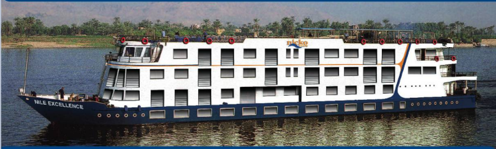
Grossartige Zeugnisse des alten Ägyptens: Tempel, Kultstätten und Gräber