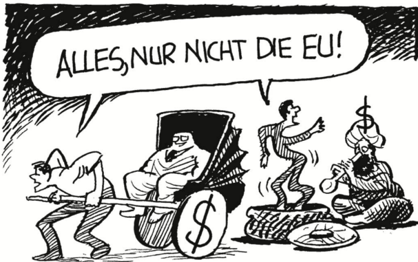
Weil China und Indien wirtschaftlich einfach sympathischer sind.