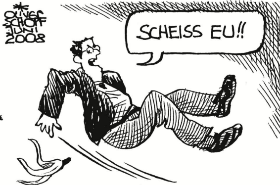
Und Brüssel darf als Feindbild nicht verloren gehen!!