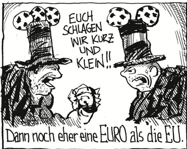
Dann noch eher eine EURO als die EU.