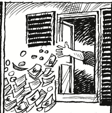
Die Lebensmittel- und Treibstoffpreise sind noch immer zu niedrig.