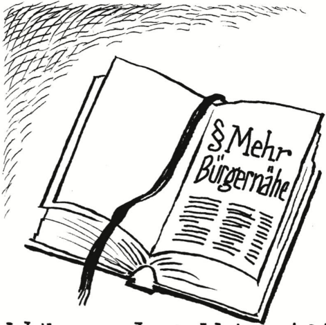
Weil genau das im Vertrag steht.