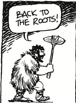
Die Subventionen sind unbeliebt.