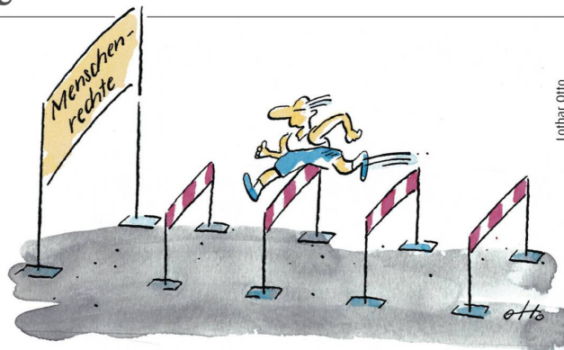
Die grössere Hürde.

China erlebt eine Explosion unternehmerischer Kreativität. Im Westen hat sich der grösste Teil aller verfügbaren Kreativität auf die Ebene des abzockenden Managements verschoben.