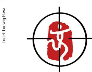
Woher das «Beijing»-Logo wirklich kommt ...