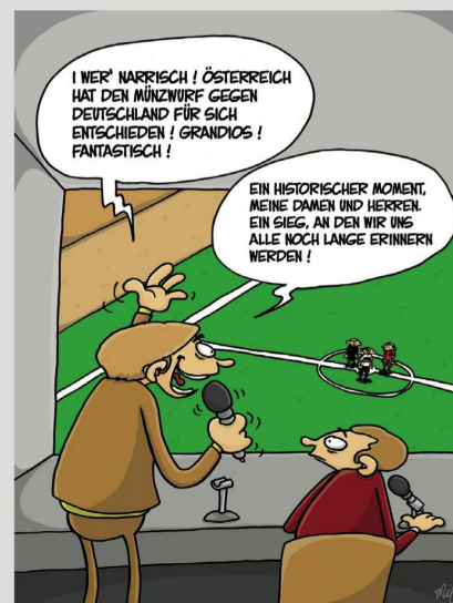
I WER' NARRISCH ! ÖSTERREICH HAT DEN MÜNZWURF GEGEN DEUTSCHLAND FÜR SICH ENTSCHEIDEN ! GRANDIOS ! FANTASTISCH !