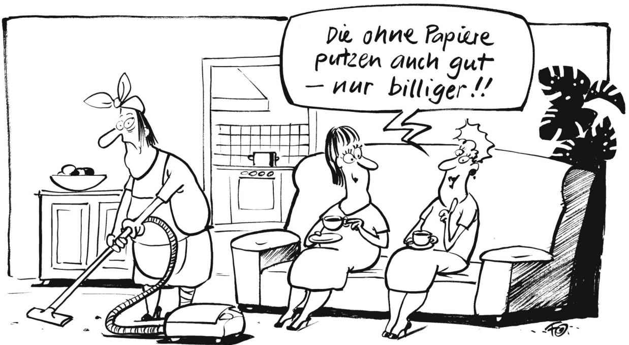
Laut einer Studie des Statistischen Amtes Basel-Stadt arbeitet jede zweite Putzfrau in Basler Haushaltungen illegal: Sie haben keine Arbeits- oder Aufenthaltsbewilligung.