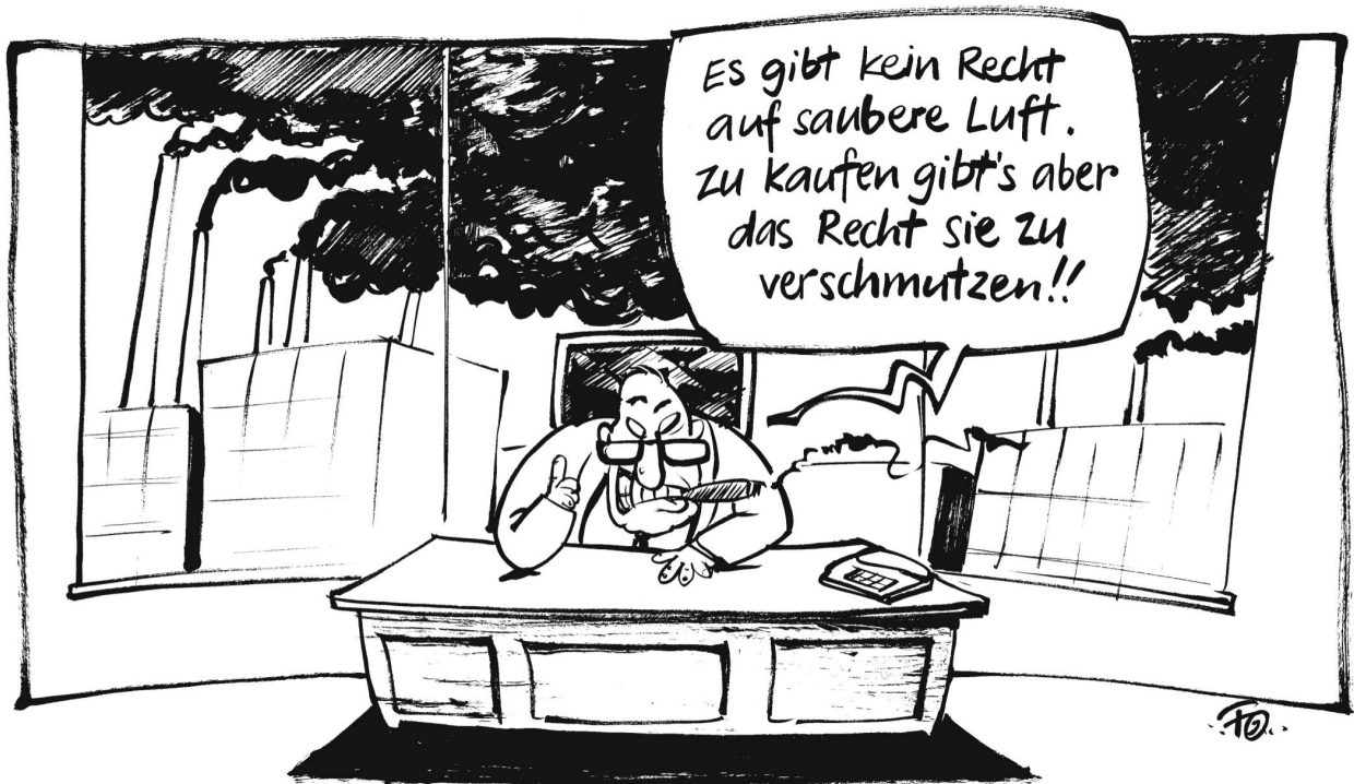
Der Anspruch auf saubere Luft kann nicht gerichtlich durchgesetzt werden: So lautet das Urteil des Bundesverwaltungsgerichts auf eine Eingabe von Privatpersonen, die von Greenpeace unterstützt wurden.