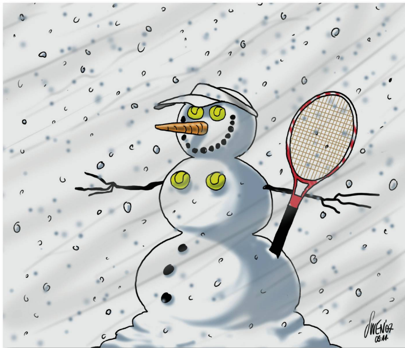
55 Nebelspalter Dezember 2007 Januar 2008