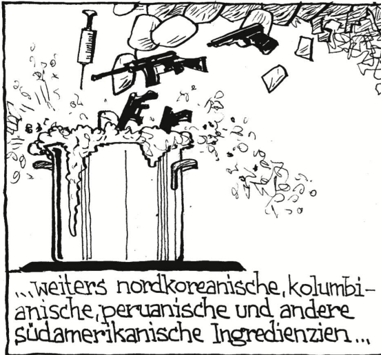
...weiters nordkoreanische, kolumbianische, peruanische und andere südamerikanische Ingredienzien...