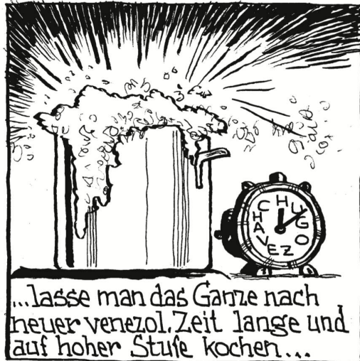
...lasse man das Ganze nach neuer venezol. Zeit lange und auf hoher Stufe kochen...