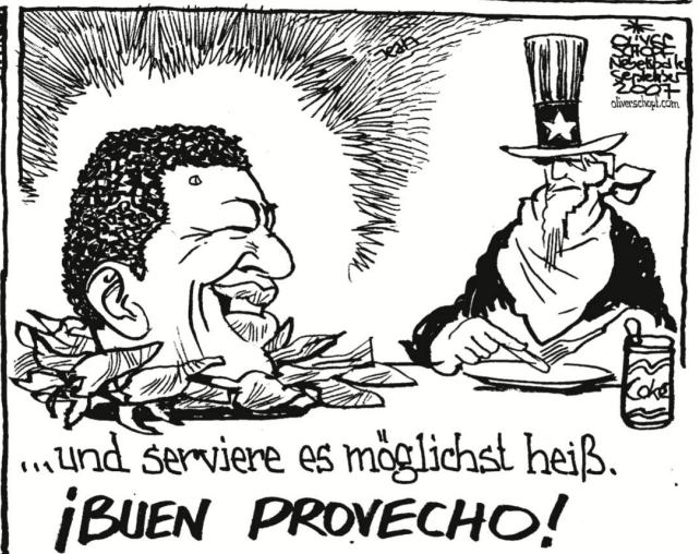
...und serviere es möglichst heiß. ¡BUEN PROVECHO!