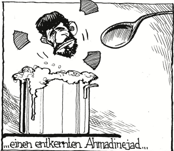
...einen entkernten Ahmadinejad...