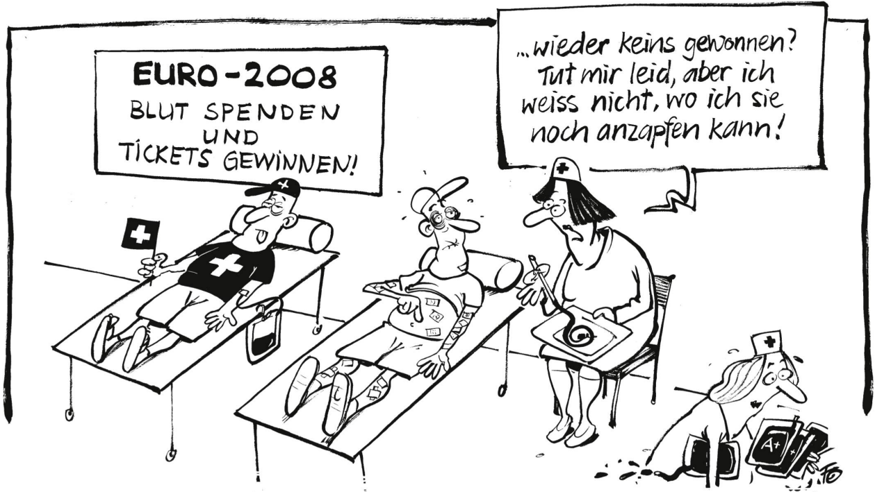
Der Schweiz droht während der Euro 2008 Blutknappheit. Nun sollen in Basel mithilfe einer Verlosung von Euro-Tickets Blutspender gewonnen werden.