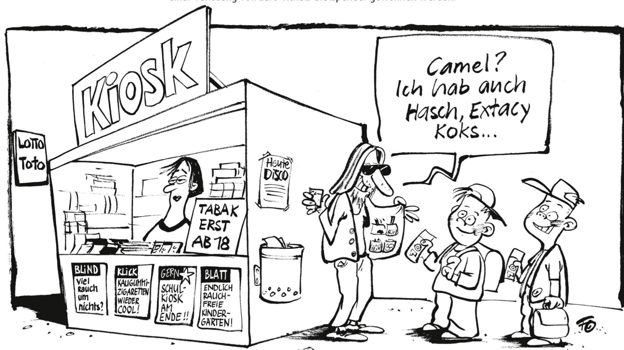
Ab dem 1. August ist es im Kanton Basel-Stadt verboten, Tabakwaren an Jugendliche unter 18 Jahren zu verkaufen. Auch Automaten verschwinden oder werden umgerüstet.

Alle Gemeinden um den Vierwaldstättersee sperren ihre Hafenanlagen am 1. August: zurück auf Feld 12.