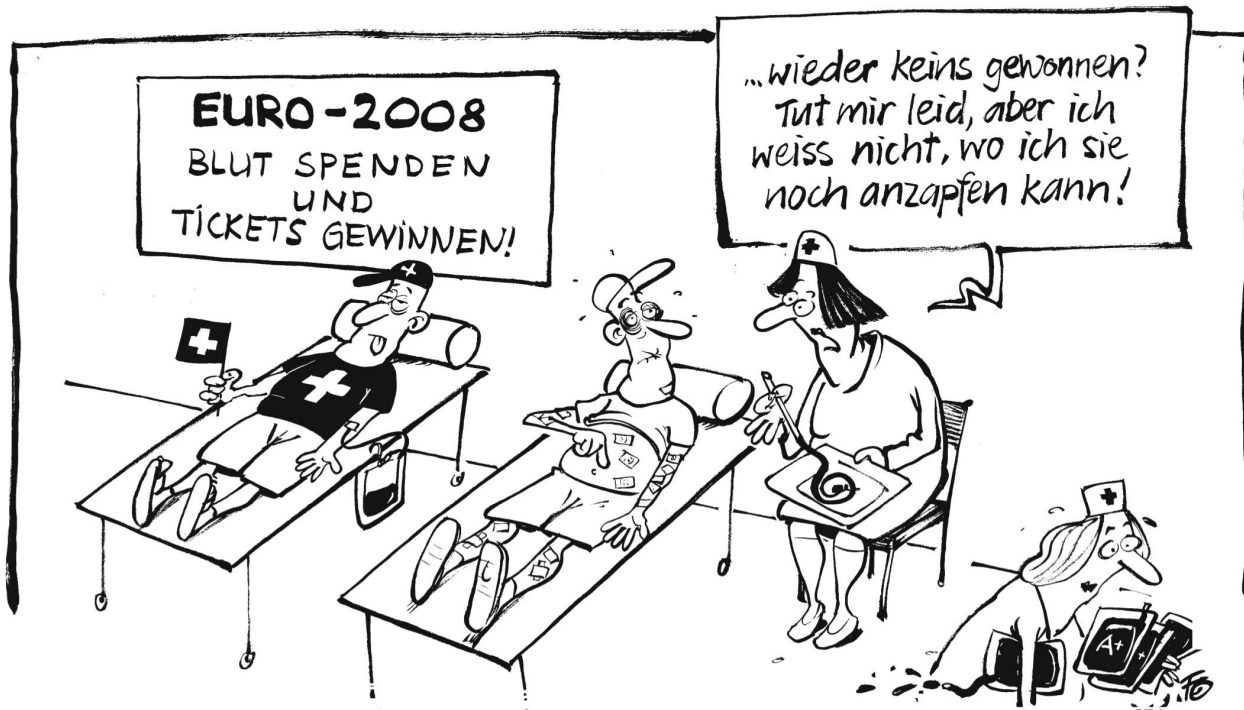
Der Schweiz droht während der Euro 2008 Blutknappheit. Nun sollen in Basel mithilfe einer Verlosung von Euro-Tickets Blutspender gewonnen werden.