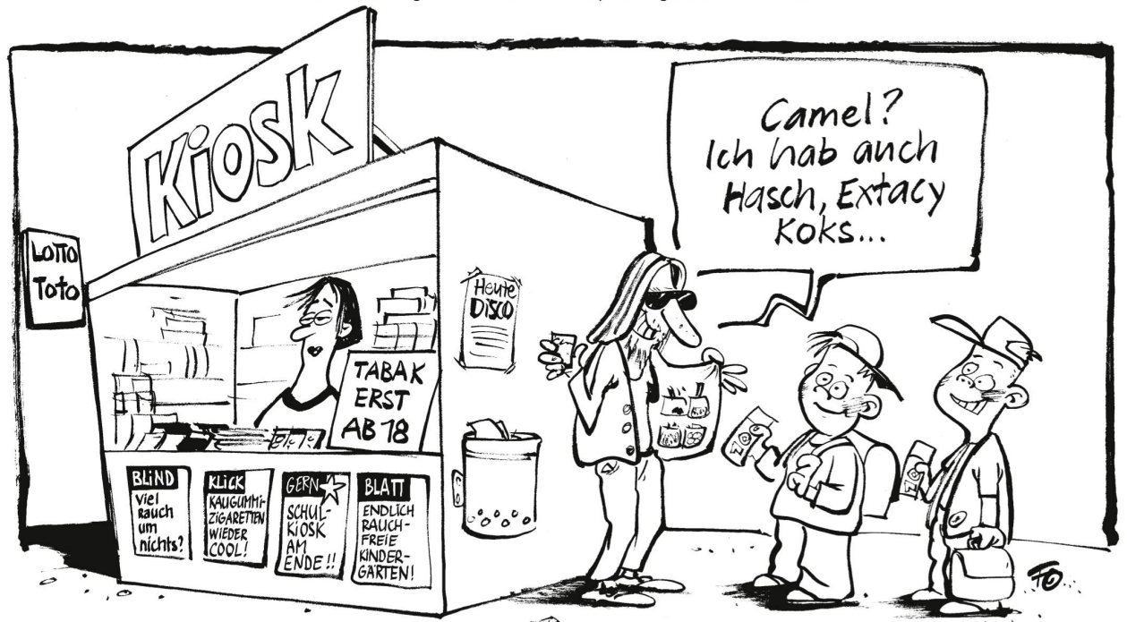
Ab dem 1. August ist es im Kanton Basel-Stadt verboten, Tabakwaren an Jugendliche unter 18 Jahren zu verkaufen. Auch Automaten verschwinden oder werden umgerüstet.

Alle Gemeinden um den Vierwaldstättersee sperren ihre Hafenanlagen am 1. August: zurück auf Feld 12.