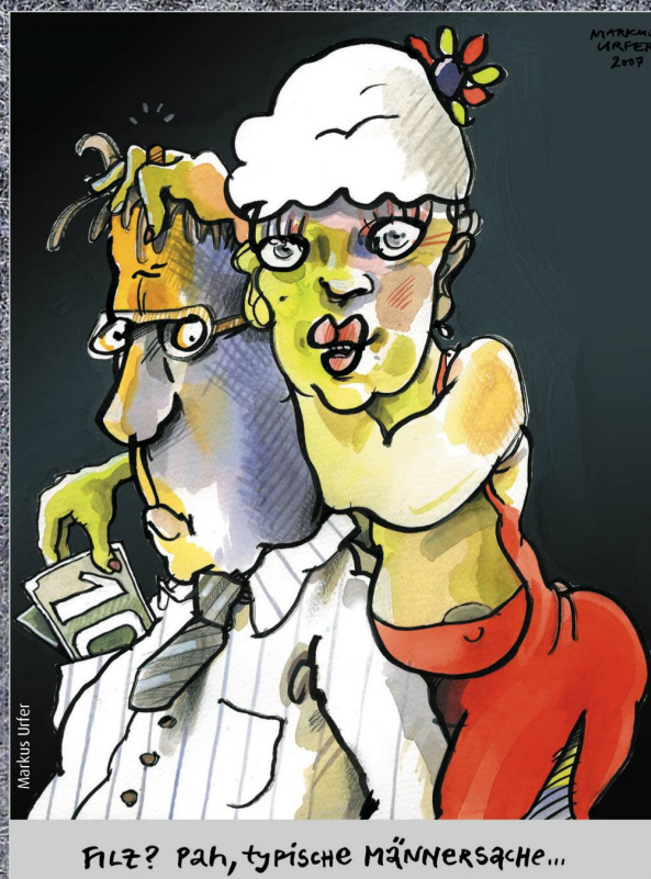
FILZ? Pah, typische MÄNNERSACHE...