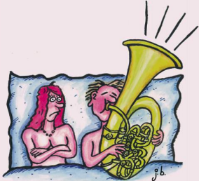
EIN ZU LAUTES VORSPIEL BRINGT NUR DIE NACHBARN AUF DIE PALME.