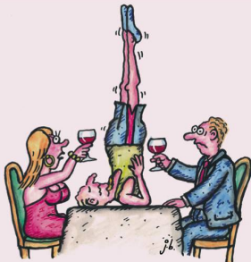
NICHT JEDE KERZE PASST ZU EINEM ROMANTISCHEN ESSEN.