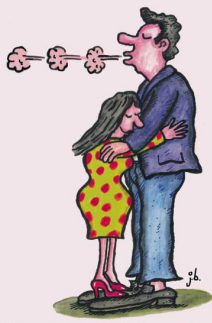
GROSSE LIEBHABER KÜSSEN OFT INS LEERE.