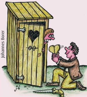
NICHT ALLE FRAUEN SCHÄTZEN ORIGINELLE LIEBESBEZEUGUNGEN.