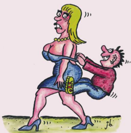
NICHT ALLE SEXSURFER SITZEN VOR DEM COMPUTER.