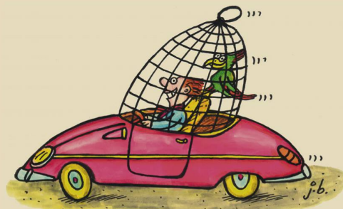
Das vogelfreundliche Carbriolet