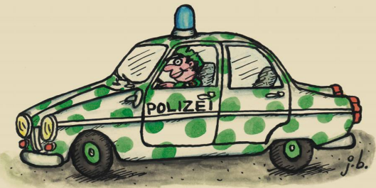
Der gepunktete Streifenwagen