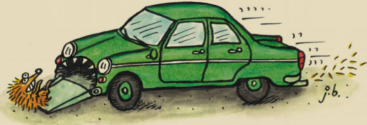
Das umweltfreundliche Biogas-Auto