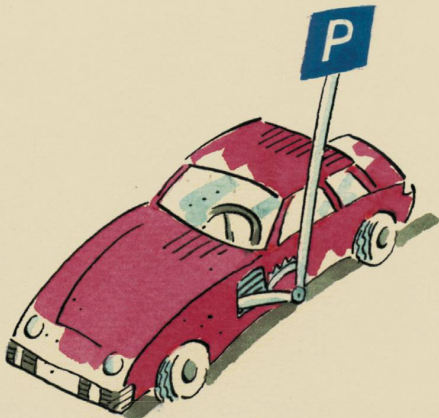
Modell „Scherzo“ (mit integriertem Parkplatzschild,