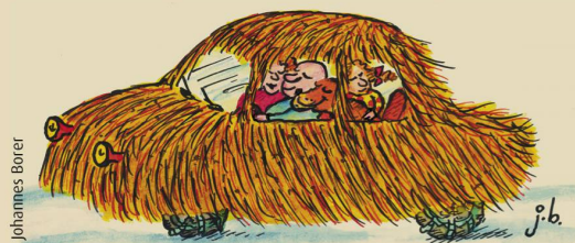
Das kuschelige Winter-Auto