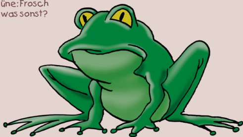
Grüne: Frosch — was sonst?