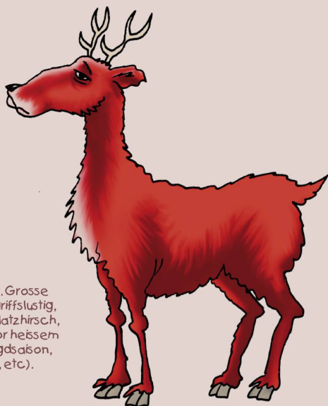
SP: Rotwild, Grosse Klappe, angriffs-lustig, spielt gern Platzhirsch, hat Angst vor heissem Herbst (Jagdsaison, Wahlen, etc.).