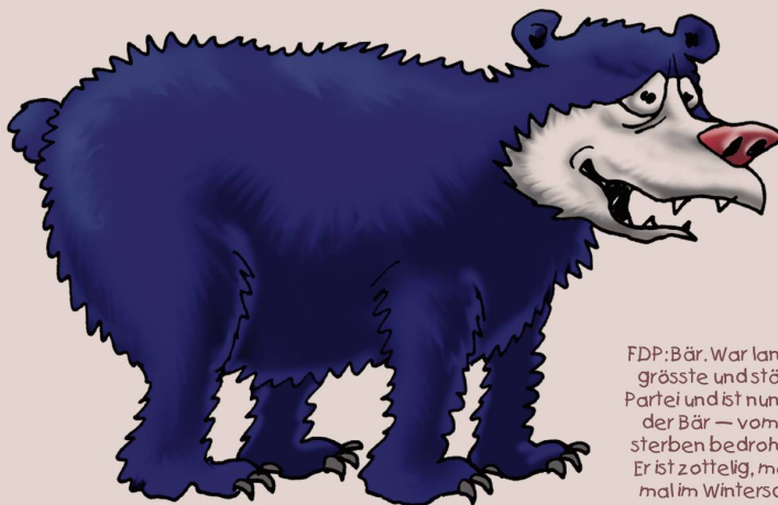
FDP: Bär. War lange die grösste und stärkste Partei und ist nun — wie der Bär — vom Aussterben bedroht. Und: Er ist zottelig, manchmal im Winterschlaf.