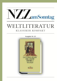
Ausgabe Nr. 10 19. November 2006 Gottfried Keller «Der grüne Heinrich»