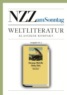
Ausgabe Nr. 2 24. September 2006 Herman Melville «Moby Dick»