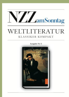
Ausgabe Nr. 5 15. Oktober 2006 Oscar Wilde «Das Bildnis des Dorian Gray»