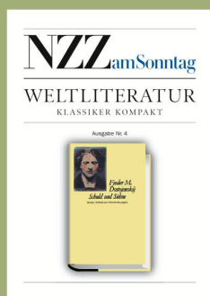
Ausgabe Nr. 4 8. Oktober 2006 Fjodor M. Dostojewskij «Schuld und Sühne»