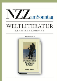
Ausgabe Nr. 9 12. November 2006 Daniel Defoe «Robinson Crusoe»