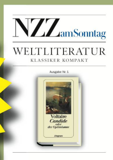
Ausgabe Nr. 1 17. September 2006 Voltaire «Candide»