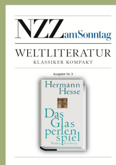
Ausgabe Nr. 3 1. Oktober 2006 Hermann Hesse «Das Glasperlenspiel»