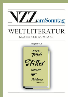
Ausgabe Nr. 6 22. Oktober 2006 Max Frisch «Stiller»