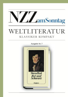
Ausgabe Nr. 7 29. Oktober 2006 Stendhal «Rot und Schwarz»