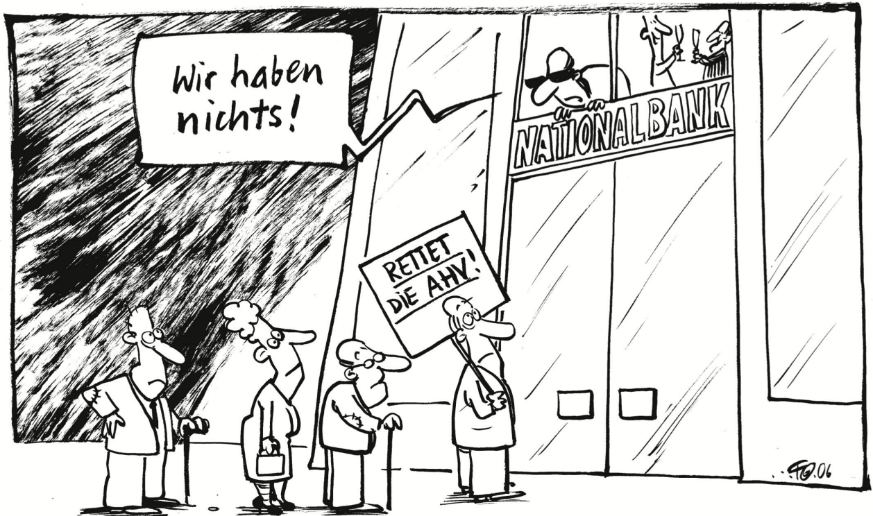
Die KOSA-Initiative wurde zur Freude der Nationalbank vom Schweizer Stimmvolk abgelehnt. Es gibt laut Nationalbank sowieso nichts zu holen.