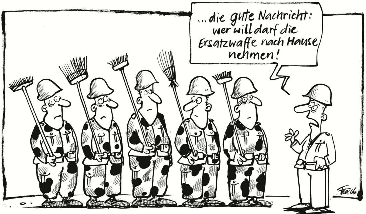
In Marly bei Freiburg wurde über das Wochenende das Waffenarsenal einer ganzen Kompanie der Schweizer Armee gestohlen. Ein Beitrag zum Thema Sturmgewehr im Schrank oder ins Zeughaus ...