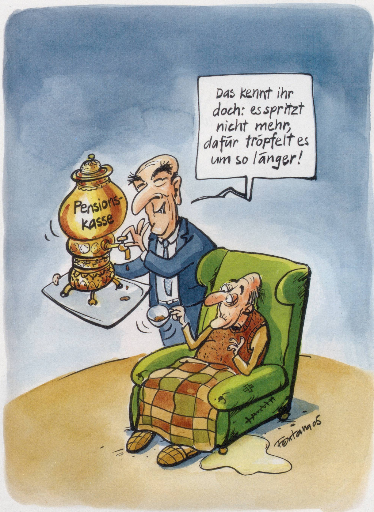
Länger leben mit weniger Rente. Der Bundesrat will den Umwandlungssatz der Pensionskassen von 7,2% auf 6,4% senken.