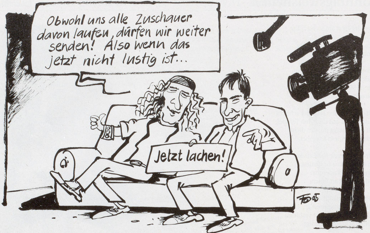
Die Quoten von «Black 'n Blond» auf SF DRS sind innert sieben Ausgaben auf ein Drittel gesunken. Trotzdem bleiben die Komiker, die sich am eigenen Lustigsein begeistern, auf Sendung.