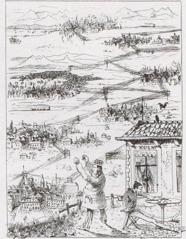
Hoteller: «Da haben wir nun die Bescherung in Folge des Schimplens. Die Kommissionler stellen sich inskünftig einfach vor das eidgenössische Kommissionstelephon und machen die Geschäfte hübsch zu Hause ab. Und unsereins soll nie was haben!» – Die Kellner: «Und wir a nitt!»