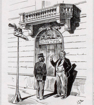
Bureauchat zum Portien. Dieser Eingang ist nur für die Beamten der Oberpostdirektion reserviert und darf vom Personal der Betriebsbüreaux nicht benutzt werden (Vide Beamtenordbruch).

Ein neues Zwinguri – Neues Postgebäude in Bern Anno Domine 1905.