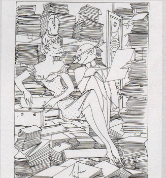
Der Papierverbrauch der Bundesverwaltung betrug im vergangenen Jahr 1950 Tonnen. Das sind 150 Tonnen mehr als im Vorjahr. «Machet mer vo dem lufuutig – oder nei, säge mer achttausig Abzug, Frolein Lugluebel – es isch en ufueel zum Papier-Schpare!» Der Papierverbrauch der Bundesverwaltung betrug im vergangenen Jahr 1950 Tonnen. Das sind 150 Tonnen mehr als im Vorjahr. «Machet mer vo dem lufuutig – oder nei, säge mer achttausig Abzug, Frolein Lugluebel – es isch en ufueel zum Papier-Schpare!»