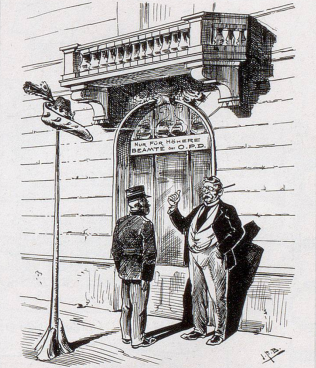
Bureauchat zum Portien. Dieser Eingang ist nur für die Beamten de Oberpostdirektion reserviert und darf vom Personal der Betriebsbureaux nicht benutzt werden (Vide Beamtenordbruch).