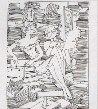
Der Papierverbrauch der Bundesverwaltung betrug im vergangenen Jahr 1950 Tonnen. Das sind 150 Tonnen mehr als im Vorjahr. «Machet mer vo dem lufftuisig - oder nei, säge mer achttausig Abzug, Frolein Lugluebel - es isch en uffruel zum Papier-Schpare!»