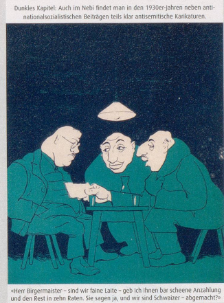
«Herr Bürgermeister – sind wir faime Laite – geb ich Ihnen bar scheenne Anzahlung und den Rest in zehn Raten. Sie sagen ja, und wir sind Schwatzer – abgemacht»