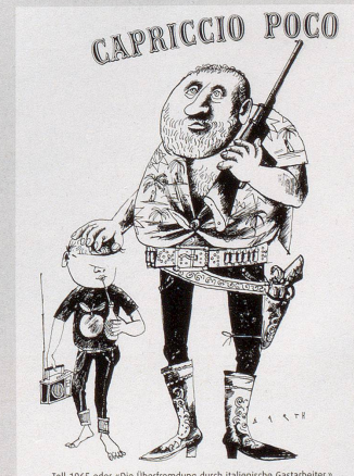
Tell 1965 oder «Die Überfremdung durch italienische Gastarbeiter»