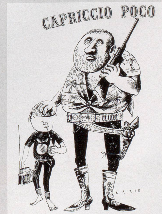
Tell 1965 oder «Die Überfremdung durch italienische Gastarbeiter»