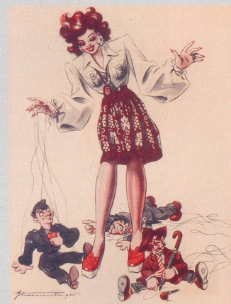
Der vom Himmel gefallene Amerikaner, eusi neuschti Konkernäz!