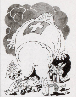
Steigende Hochkonjunktur «Bis etz ich em na wöhl. Aber mit der Zi chönnts em uuring werde!»

Besseres anzufangen, als sich zu emanzipieren. Auf den Nierentisch und die Feuerzangenbowle blickt man nun herab, als wären sie Ausdruck der übelsten Biedermeierei. Die meisten Ikonen der Zeit sind relativ früh und oftmals tragisch von der Weltbühne abgegangen. Das Wort Hochkonjunktur ist zwar auch heutzutage in aller Munde, aber keiner glaubt mehr so richtig an ihre Machbarkeit. Nur einer hat, beinahe wie ein Fossil, die Epoche überlebt, der einsame alte Mann in Havanna, Fidel Castro. Dort soll es auch noch ein wenig wie in den fünfziger Jahren aussehen, nur fehlen der Glanz und Optimismus. Castro hatte auch nie was mit freiem Markt und Wirtschaftswunder im Sinn, sich vermutlich auch nie gefragt, was Frauen wünschen. Er, der sich als ungeschickter, aber zäher Revolutionär und zaudernder Ideologe einen Namen gemacht hat, führt nun ein spartanisches Leben und hält manchmal noch fünfstündige Reden, die er nach wie vor mit dem Pathos des Kalten Krieges vorzutragen pflegt, was einige seiner Zuhörer aber nicht vor dem Einschlafen bewahrt.