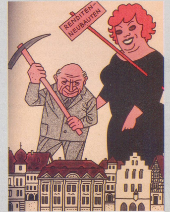
Hochkonjunktur und Spekulation, die Schrecken der alten, schönen Stadtteile.