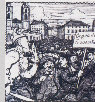
Nobelpalster: «Nur keine Aufregung, werteste Herren! Es handelt sich nur um eine Formsache. Unsere Gesetze machen ja ohnehin die Frauenvereine.»