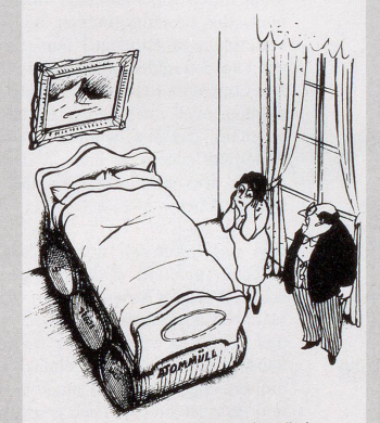
«Ich als Kraftwerkdirektor will den A-Werk-Gegnern beweisen, wie harmlos die Lagerung atomaren Mülls im Grunde genommen ist.»