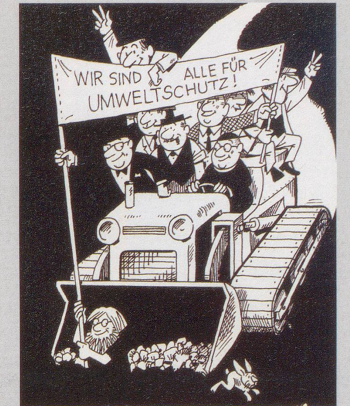
Neun Parteien und politische Bewegungen haben zweierlei gemeinsam: Sie sind für Umweltschutz und sie beteiligen sich an den eidg. Erneuerungswahlen, ein Zusammenhang dürfte nicht rein zufällig sein.