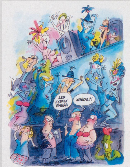
Nach illegalen Höhenflügen und chemisch gesteigerter Potenz, bald: Werden Sie legal schmal mit Xenical!