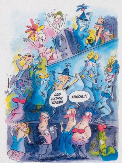
Nach illegalen Höhenflügen und chemisch gesteigerter Potenz, bald: Werden Sie legal schmal mit Xenical!