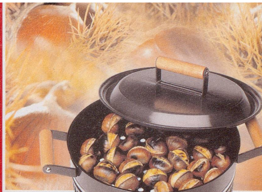
Design: Herbert Forrer

Für weitere Informationen wenden Sie sich bitte an den Abonentendienst: Tel. 071 846 88 76, Fax 071 846 88 79 abo@nebelspalter.ch