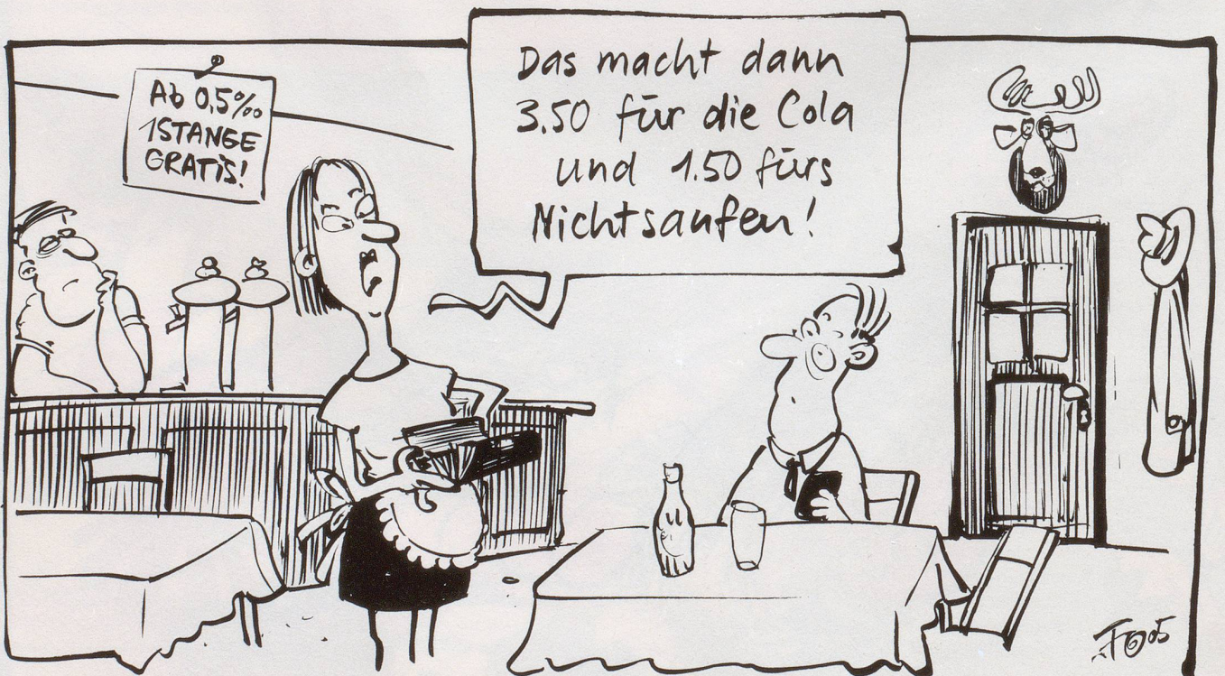
Seit der Einführung der 0,5-Promillegrenze klagen Westschweizer über Umsatzeinbussen. Sie erwägen einen «Pane e coperto»-Zuschlag, um den sinkenden Alkoholkonsum auszugleichen.