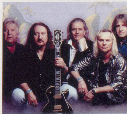
Urgestein des britischen Rocks: Uriah Heep