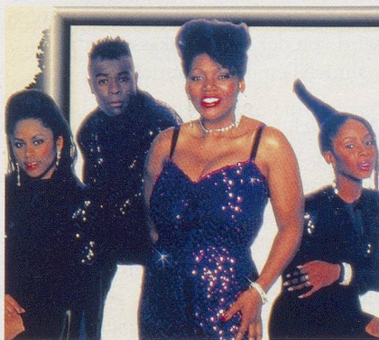
Glitterrock-Stars der 70er-Jahre: Boney M.